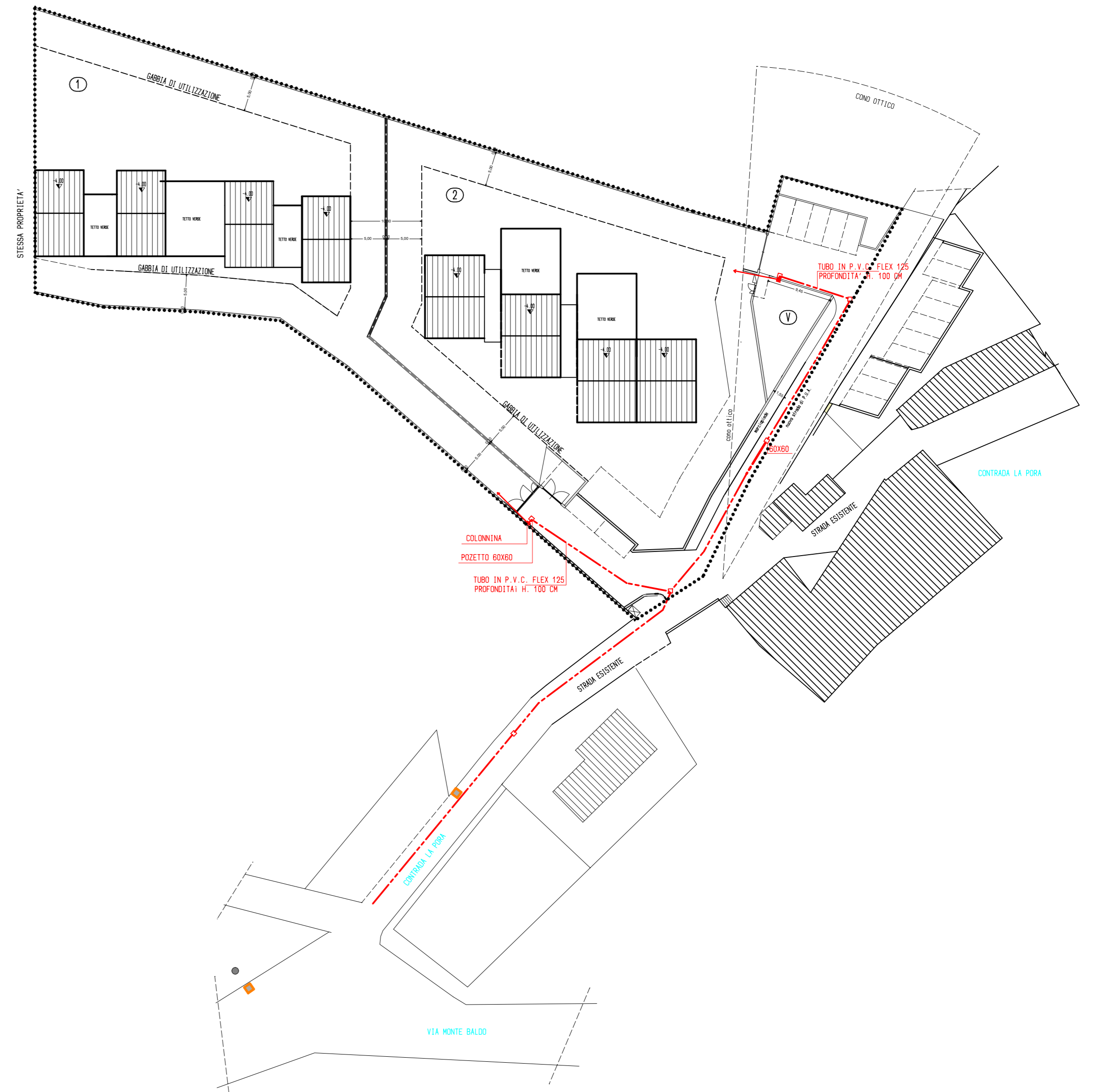
RETE DISTRIBUZIONE GES METANO